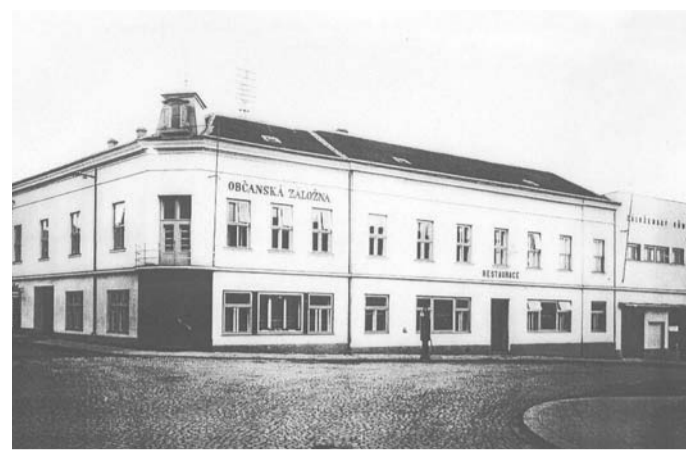
Občanská záložna a restaurace - dnešní hlavní budova gymnázia