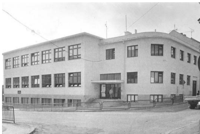
Druhá budova gymnázia

Pokud manžel platí v době manželství hypotéku ze svého účtu, je třeba uvést, že finanční prostředky manželů jsou společné, takže hradí hypotéku ze společných prostředků, byt jsou vedené na bankovním účtu na jeho jméno. Pokud by se tedy byt vypořádal v případě rozvodu manželství, dělil by se mezi oba manžele s tím, že by se musela mezi manžele dělit i hypotéka, která byla za manželství čerpána na koupi tohoto bytu. Manžel pak má právo uplatnit částku, kterou vložil ze svých výlučných prostředků do koupi bytu a ta by mu měla být při vypořádání zohledněna.