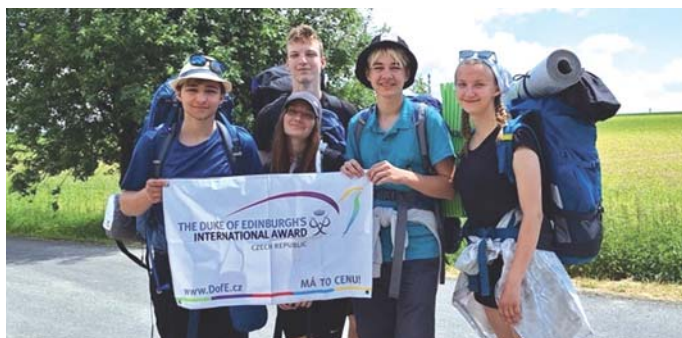
DofE - stříbrná expedice studentů GMK

Gymnázium Moravský Krumlov je tradičním poskytovatelem neformálního a zájmového vzdělávání, které doplňuje a dále zkvalitňuje formální (klasické) maturitní vzdělávání. Kromě kvalitní vysokoškolské přípravy tak nabízí pro své studenty pestrou škálu zajímavých a dostupných aktivit, jako jsou DofE, mezinárodní program pod záštitou britské královské rodiny, divadelní kroužek EĐAS, Czech Rocket Challenge, aktivní členství ve FabLab Brno, kroužek robotiky, novinářský kroužek, který vydává školní časopis, či charitativní projekty studentského parlamentu.