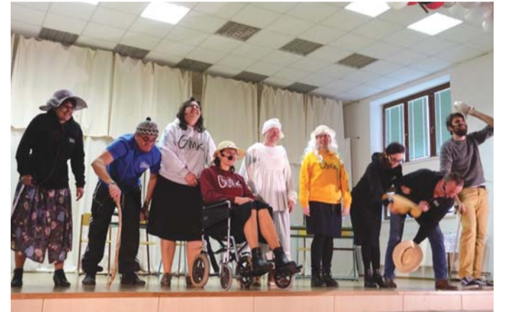
Školní akademie Gymnázia Moravský Krumlov

Poté přišly na řadu zprávy nového televizního kanálu, který si můžete „naladit“ pod názvem GMK, doplněné o prezidentskou „Superdebatu“. Ta nás opět na malou chvíli vrátila zpět ke slovenštině. A nyní již nastal čas pustit si Sněženky a machry, Slunce, seno, gympl a celé to zakončit pohádkou O třech bratřích.