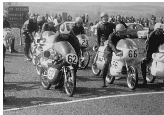
Start silničních závodů v kubatuře 50 ccm na okruhu „Na Slatinách“, zdroj: archiv F. Sobola (rok neznámý)

Závod, kterému vždy předcházela dopolední trénink, byl vypsan hned v několika kubaturách, přičemž během prvních ročníků se jednalo o objemové třídy 175, 250 a 350 ccm, později zůstaly už