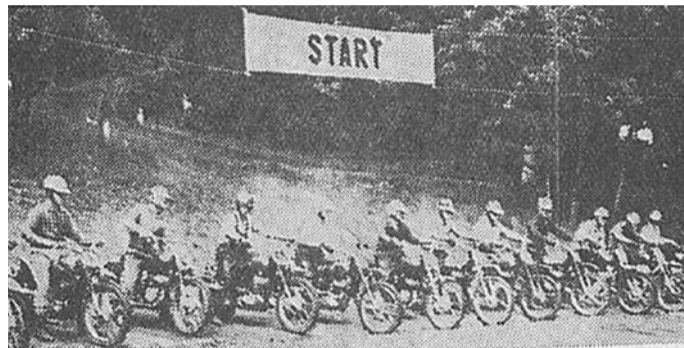
Start motokrosových závodů v roce 1966, zdroj: oficiální program akce (1967)