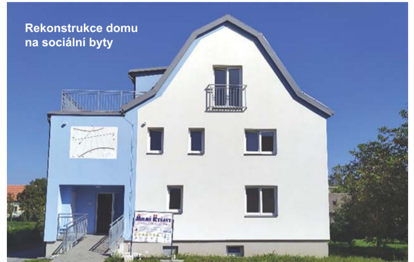
Rekonstrukce domu na sociální byty

Všechny tyto dokončené stavební investiční projekty byly slavnostně otevřeny za účasti pozvaných hostů včetně starostů z okolních obcí. Poté byla umožněna prohlídka občanům z Damnic a okolí. Jedná se o velmi povedené stavební projekty, na které byly získány vysoké dotace v řádech desítek milionů korun.