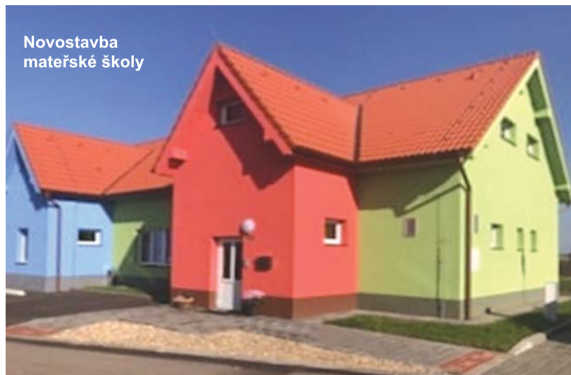
Novostavba mateřské školy

První stavební projekt - novostavba bytového domu s pěti bytovými jednotkami včetně potřebného technického zázemí a zpevněných parkovacích ploch byla dokončena v září roku 2020.