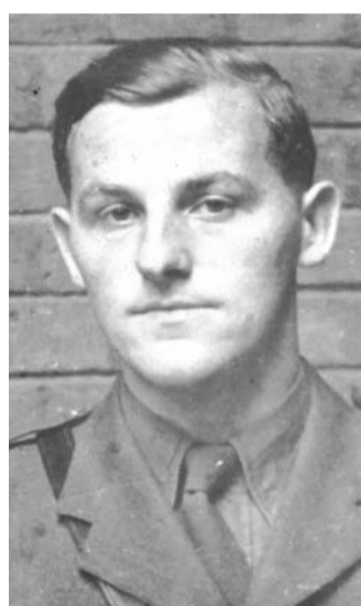
Adolf Opálka z Rešic

Letos uplyne 27. května přesně osmdesát let od provedení atentátu na zastupujícího říšského protektora Reinharda Heydricha.