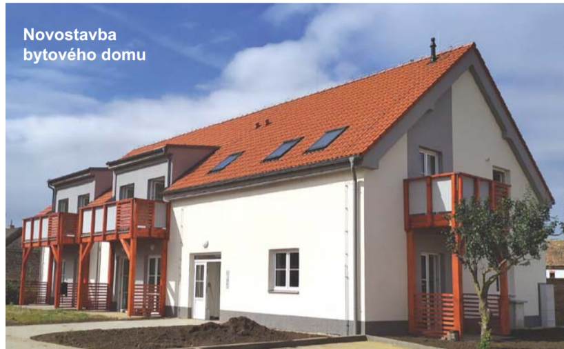
Novostavba bytového domu