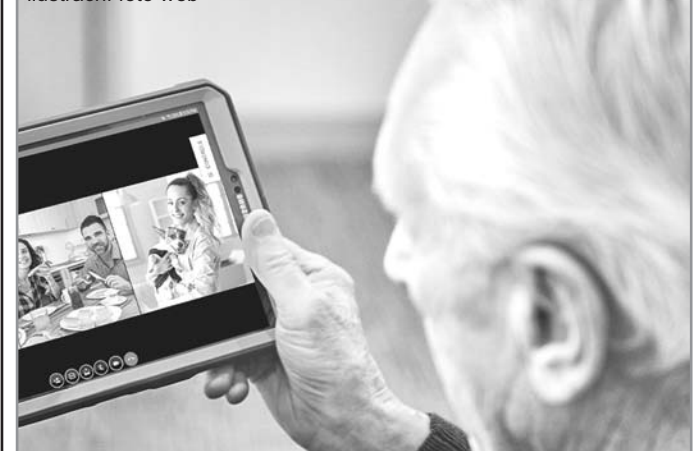
ilustrační foto web

Je jasné, že rozbitý nebo nefunkční dar nikoho nepotěší. Proto prosíme, než se jej rozhodnete darovat, zkuste tablet nabít, zapnout a odzkoušet (hlavně kameru). Drobné vady na kráse (odřený či naprasklý displej, ošoupané plasty atp.), slabší baterie či hardware nevdá, ale hodné poškozený tablet už neposlouží nikomu. Sami zvažte, co má smysl darovat a co už patří raději do odpadu. Naopak, funkční, i když trochu životem opotřebovaný tablet, potěší každého, kdo by rád zase viděl své nejbližší a vyměnil si s nimi pár milých vět.