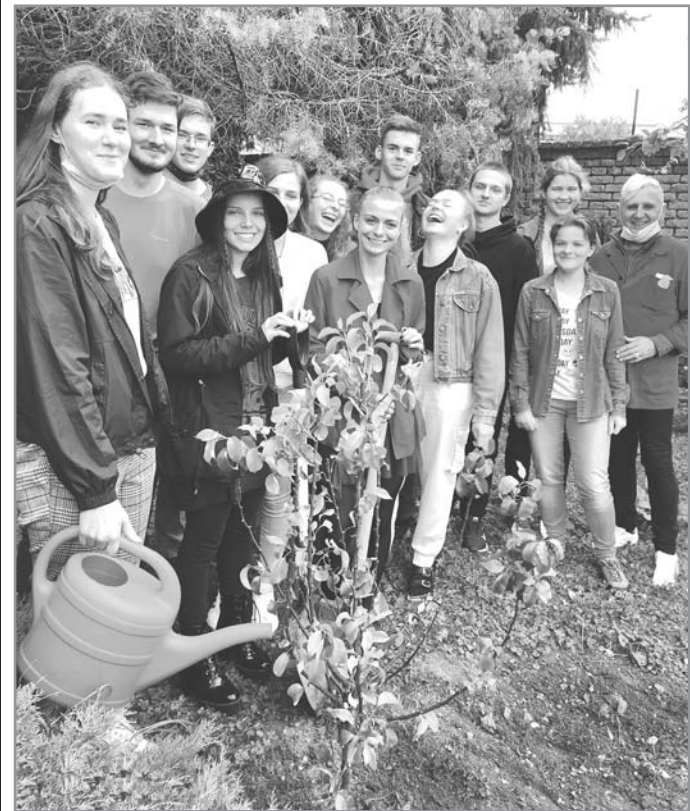
Sázení hrušně na zahradě GMK.