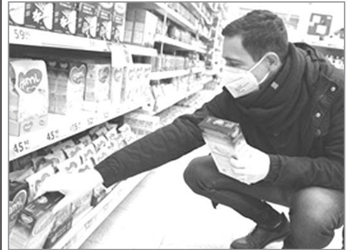
podrobnosti na: https://www.sbirkapotravin.cz .

Sbirku potravin pro potřebné se podařilo zorganizovat i přes komplikovanou situaci způsobenou koronavirem. Lidé mohli v tento den věnovat trvanlivé potraviny nebo drogistické zboží ve stovkách obchodů po celé České republice. Tato charitativní akce bývá organizována ve všech krajích potravinovými bankami a Českou federací potravinových bank ve spolupráci se Svazem obchodu a cestovního ruchu a Asociací společenské odpovědnosti, se sociálními partnery Charita Česká republika, Armáda spásy, NADĚJE a Slezská diakonie a obchodními řetězci Albert, Billa, dm drogerie markt, Globus, Kaufland, Lidl, MAKRO, Penny Market, ROSSMANN, Tesco a Rohlík.cz.