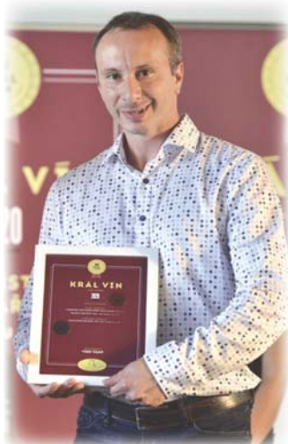
V srpnu jsme získali vynikající ocenění v soutěži KRÁL VÍN

Kvůli výstavbě průtahu v obci Rybníky se přímo do vinařství dostanete ze strany od Dobelic.