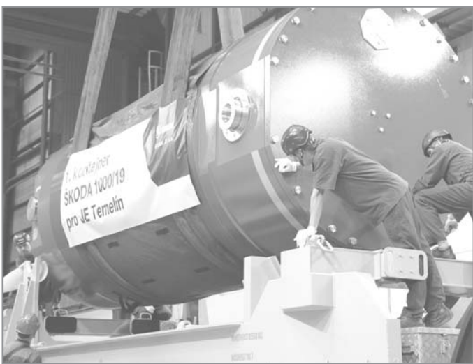
Přeprava 1. kontejneru ŠKODA pro JE Temelín

ktej nám v krátkosti představil ŠJS, její výrobní program a aktuální stav podniku, a my jemu jsme navštívili výrobní prostory, ve kterých probíhá výroba pohonných regulačních systémů reaktorů VVER 440 a VVER 1000. Viděli jsme také výrobu a laserové svařování vnitřních košů pro kontejnery na použité jaderné