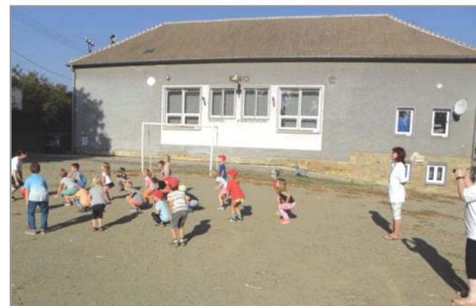
Nová budova Sokolovny

Jednota vlastnila v té době již bradla, hrazdu, kladinu, koně, kruhy, žíněny, šplhadla, oštěp, stojany ku skoku a můstek, vše v hodnotě 3.512,- korun. Vybavení tělocvičny, jeviště, knihovny spolu s cenou nářadí udávalo jmění ve výši 12.475,17 korun. K 31. 12. 1919 bylo evidováno 11