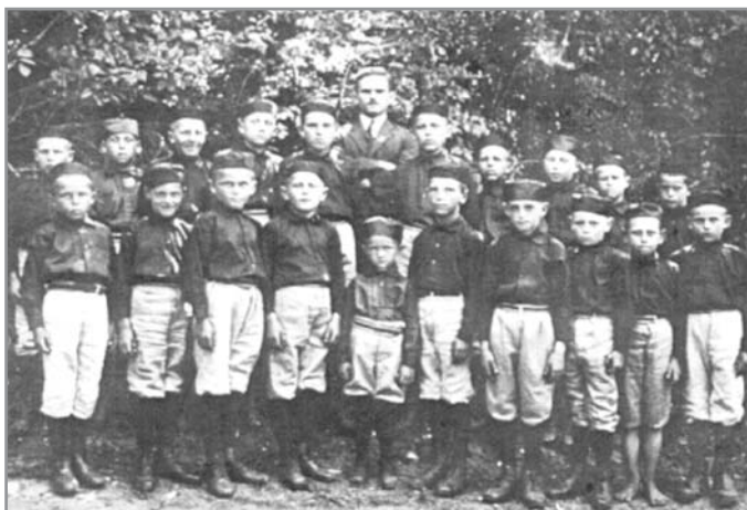
Výlet na Hlínu malých „sokolůků“ v r. 1919