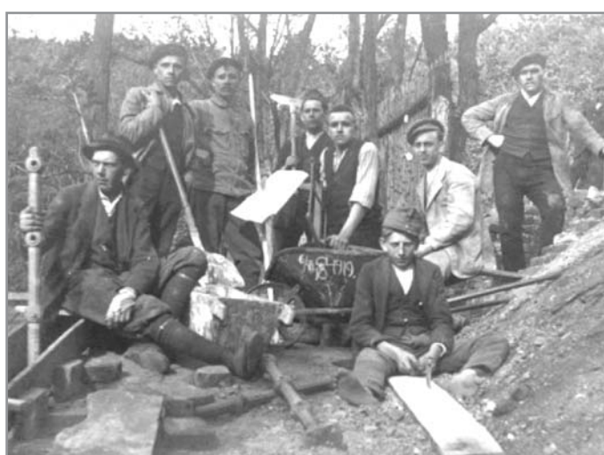
Úprava terénu - cvičiště Františka v r. 1919

Ano, vážení čtenáři, je to sté výročí. Vzhledem k tomu, že budou prázdniny, rozhodl výbor TJ, že oslavou tohoto jubilea uskutečnime 28. 9. 2019 . Bu-