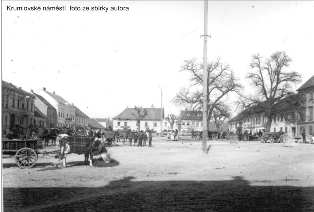
Krumlovské náměstí