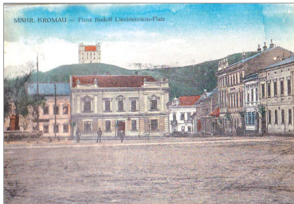
Náměstí v Moravském Krumlově na dobové pohlednici

Literatura: • Fišer, Z. (red.) 2009: Moravský Krumlov ve svých osudech. Brno • Kriebel, O. - Karásek, J. 1925: Moravsko Krumlovsko a Hrotovsko. Vlastivědný sborník. Moravský Krumlov • Kuča, M. - Kacetl, K. 2016: 150 let státní dráhy z Brna přes Moravský Krumlov do Vídně a do Znojma. Železniční trať Střelice-Moravský Krumlov-Hrušovany n/J-Laa a/T-Wien-Stadlau s odbočkami do Znojma a do Oslavan. Moravský Krumlov • Sloschek, E. 1937: Geschichte der Stadt Mährisch-Kromau. Znojmo • Voštera, A. (nedatováno): II. Historie města Moravského Krumlova od r. 1686-1848. Moravský Krumlov.