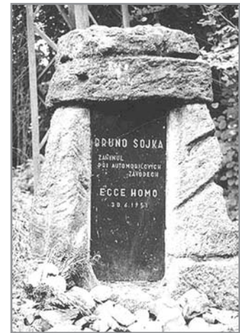
Pomník na místě nehody, při které Bruno Sojka zahynul

Sojka vyrazil po startu jako střela, řítil se k prudké pravotočivé zatáčce, nezpomaloval, vůbec nebrzdil a nepochopitelně vyjel na protější stranu vozovky, jel hodný kus téměř příkopem, byl nadhozen nízkou hromádkou a téměř kolmo narazil na patník. Tatraplán