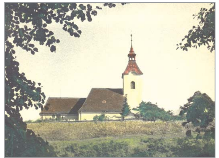
Farní kostel všech svatých v Moravském Krumlově.