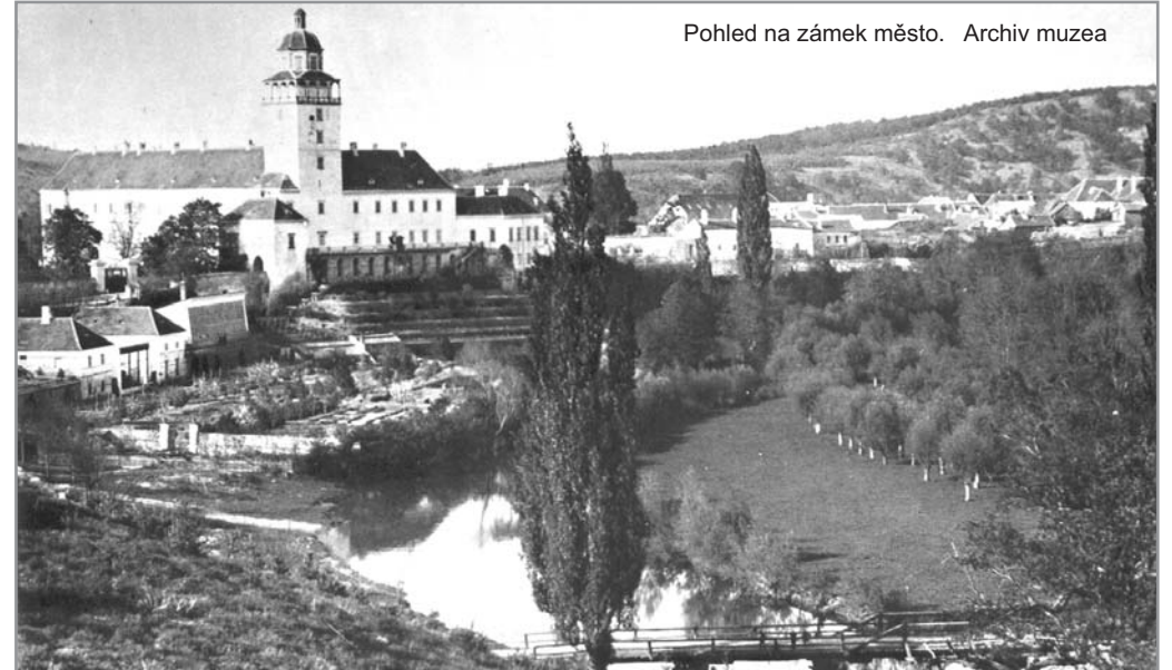
Pohled na zámek město.

(4) zdanění komínů - váže se k historii komínictví. Za každý komín se platila od roku 1676 císařská daň. Platit musel každý napříč spektrem majetkové struktury obyvatelstva. Kdo neplatil, byl mu zbourán komín i s kamny. Zákony se obcházely například svedením 4 kouřovodů ze čtyř kamen do jednoho komína.