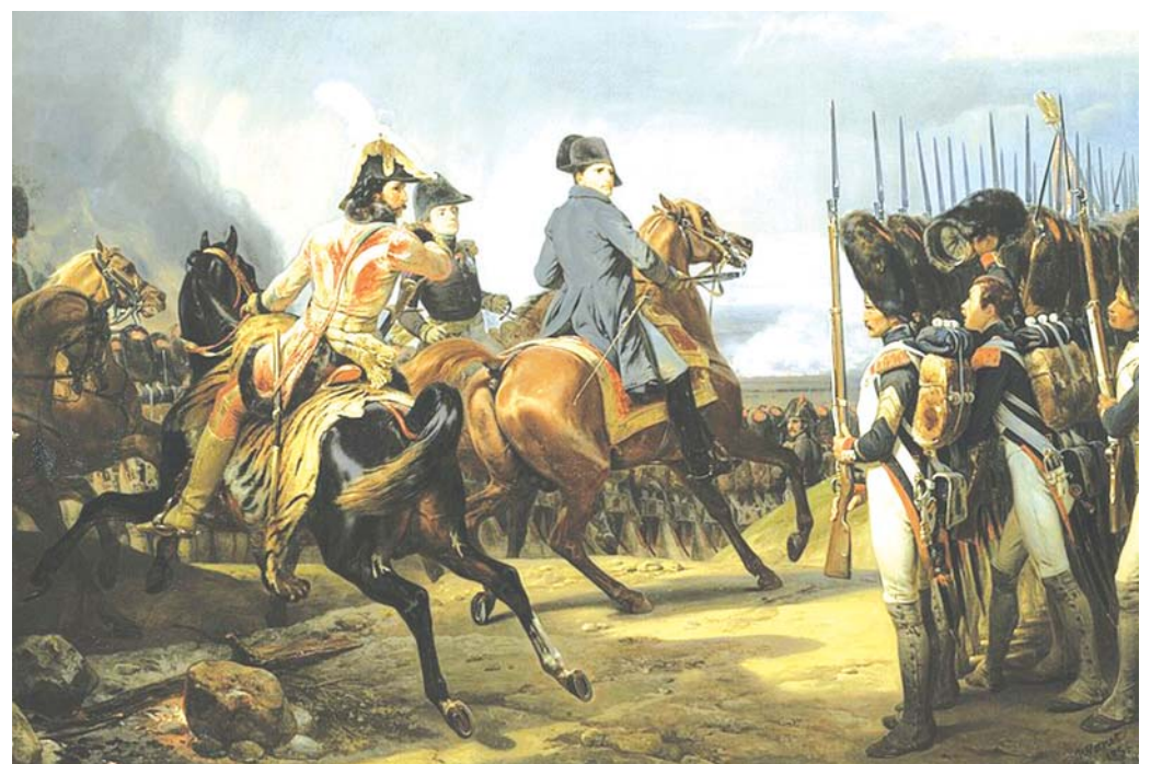
Napoleon se svou císařskou gardou před bitvou u Jeny