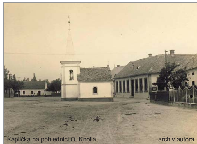
Kaplička na pohlednici O. Knolla