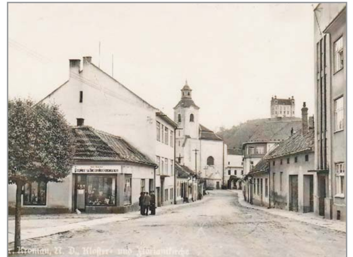
Kaple sv. Floriána v pozadí historické pohlednice