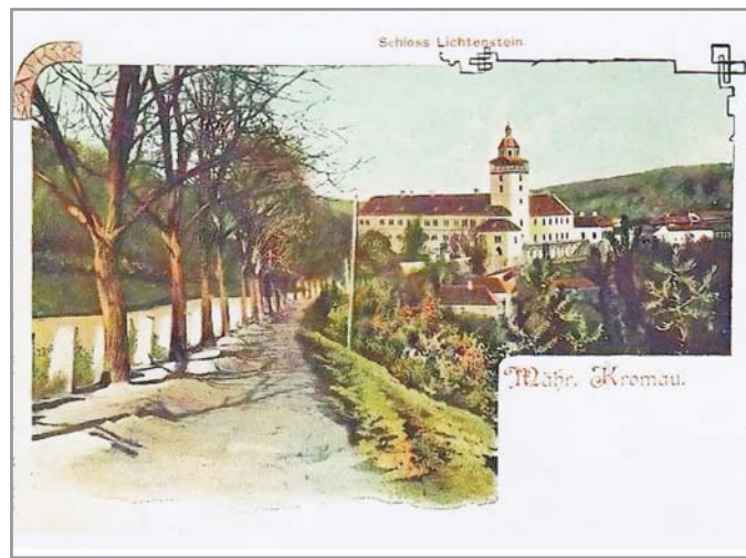
Zámek v Moravském Krumlově na historické pohlednici