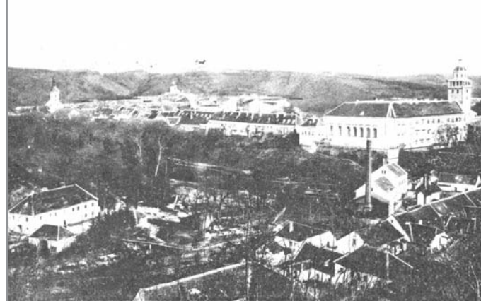
Podzámčí se zámek. Pohlednice z archivu muzea

jektů a prostor, včetně těch, které jsou jinak zčásti nebo zcela nepřístupné. Jsou významnou kulturně poznávací společenskou akcí, která slouží k posílení historického povědomí v nejbližších souvislostech se zvláštním důrazem na vnímání mezinárodního kontextu národního kulturního dědictví.