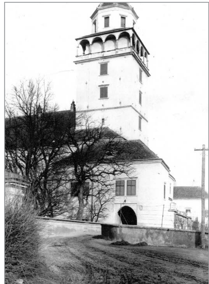
Přeložení vjezdu do města se uskutečnilo roku 1953.

Jaká byla situace například ve 2. polovině 19. století? Pro