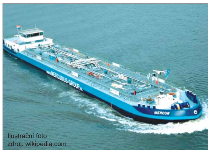
Ilustrační foto zdroj: wikipedia.com

Ně vše, co je sympatické, co naplňuje radosti a pýchou, musí být a priori také dobré nebo dokonce vůbec reálné. Propojení tří moří je jistě lákavé, protože lodní doprava je především levná, třebaže poněkud pomalejší.