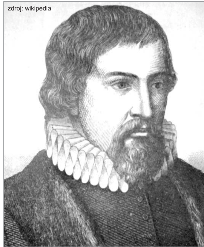
Fiktivní podoba Jana Blahoslava podle představy umělce 19. století.

Zajímavostí z okolí: Klášter v Dalešicích po více než 250letém trvání zanikl k roku 1560. Ves Výmyslice byly roku 1556 povýšeny na městečko, získaly svůj znak (až roku 1564 - šipka s okovem) a současně bylo městečko povoleno mít dva výroční trhy a právo pečeti. Biskupice byly roku 1570 povýšeny na městečko a získaly svůj erb. O přesné lokalizaci panského sídla v Březníku se vedou dohady. Podle posledních poznatků se nacházelo zřejmě v bezprostřední blízkosti kostela. Martin Kuča