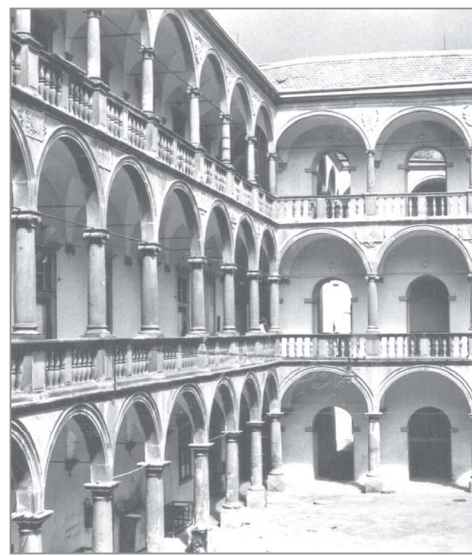
Arkády krumlovského zámku. Výřez z pohlednice.

Zajímavostí je zmínka v pramenech, páni z Lipé měli u obcí Dobřínsko a Budkovice dobře