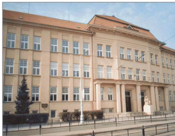
Brno, Merhautova 37 - odtud odjelo 9397 Židů do koncentračních táborů.

V Brně ve sběrném táboře na Merhautově ulici se všichni zdrželi několik dní a dočkali se pořádné změny. Přestali být lidmi a stali se pouhými čísly v transportu do Terezína. O jejich dalších osudech jsou informace v Terezínské pamětní knize, která obsahuje téměř 80000 jmen lidí z Čech a Moravy. U každého je zapsáno číslo osoby, označení transportu, datum odjezdu z Terezína a cíl transportu. Datum je důležité, protože je použi-