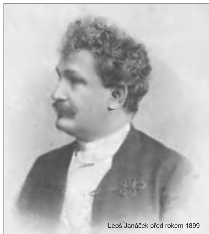
Leoš Janáček před rokem 1899