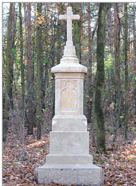
Kříž na Rěně byl opraven v roce 2015