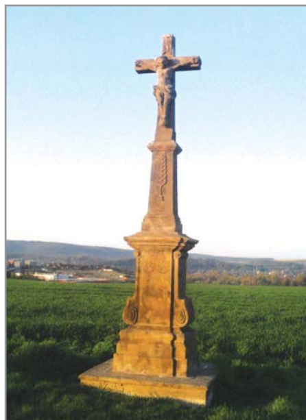
Kříž v Lánech pochází z roku 1812