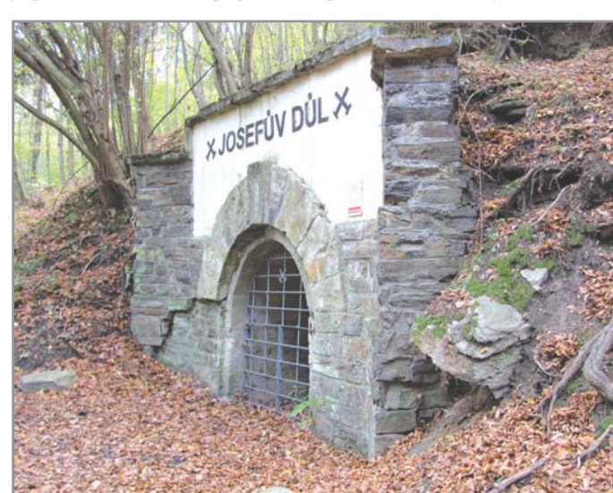
Čučice, Josefův důl, fotografie ze dne 31. 12. 2016

smutný konec 2. sv. války, kdy 5. května 1945 byli v budově radnice zastřeleni tři občané Čučic. Vracíme se znovu po silnici k zastávce autobusu, odkud pro nás začíná zelená značka, po které půjdeme minimálně dalších 7,5 km. Scházíme po svahu se zaklesnutými domy „Baráky“ nad roklí Čučického potoka. Míjíme odpadní dvůr a po cca 200 metrech scházíme prudkou pěšinou k Čučickému potoku.