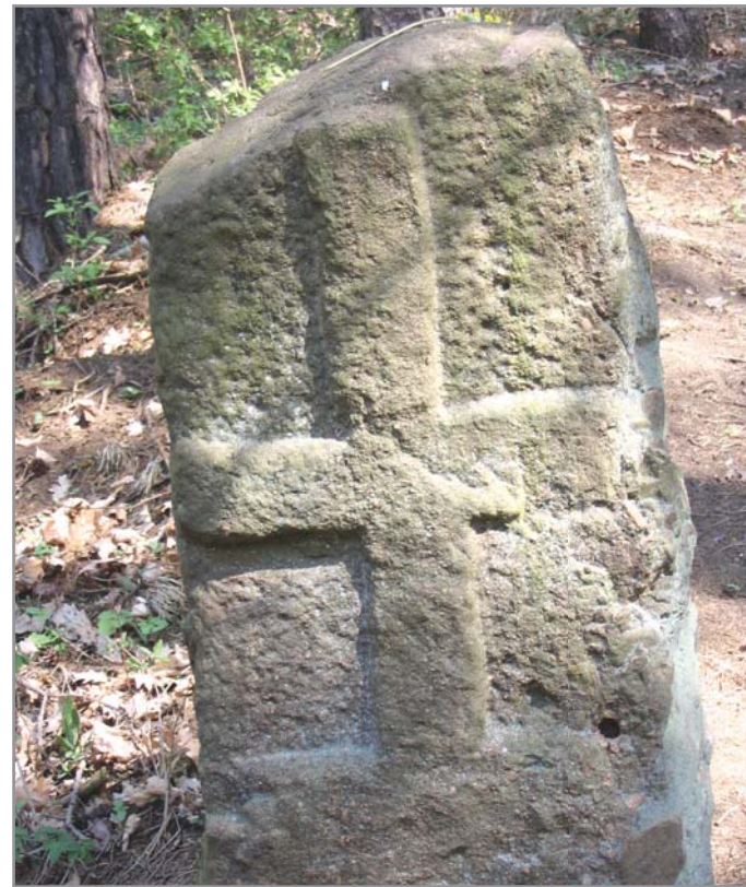
Francouzský kámen - zde zahynul voják Napoleonovy armády

Klub českých turistů, odbor Ivančice, pořádá každoročně rozloučení se starým rokem - výšlap do Čučic a zpět. Také 31. prosince 2016 se sešlo kolem 50 turistů, kteří měli sraz v Oslavanech na autobusovém nádraží a kolem 9. hodiny vyrazili směrem k Čučicím. Vodičkem byla zelená turistická značka, ale menší skupinky turistů volily cestu i mimo označenou trasu.