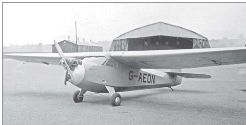
Letadlo české výroby Praga E 114