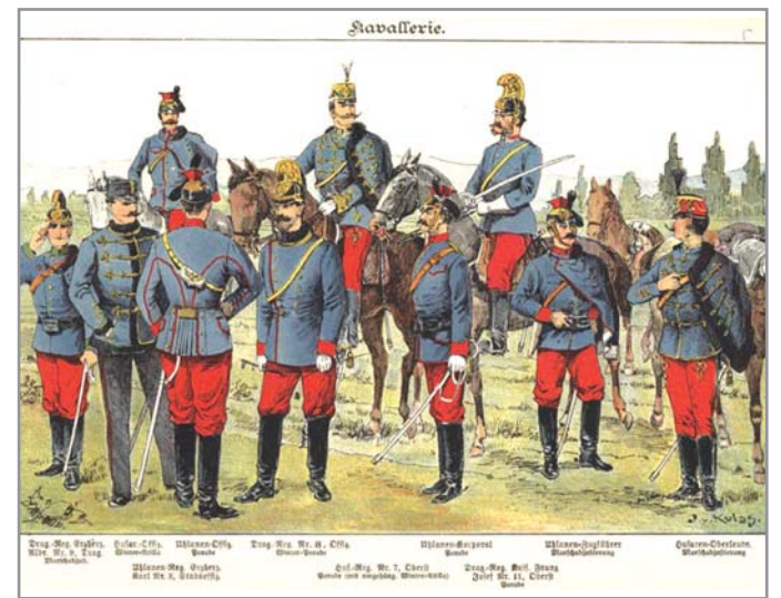
Jezdectvo c. k. rakouské armády

Rok 1809 byl městu Mor. Krumlovu, právě tak jako říši rakouské, velmi osudným. Rakousko válčilo