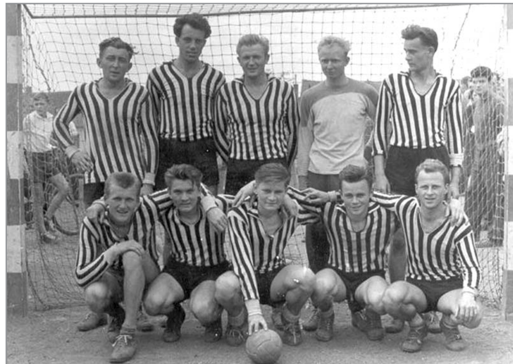
Postupujeme do druhé ligy - 5. července 1959 (Slovan Ivančice vs. Sokol Klimkovic 25:13)