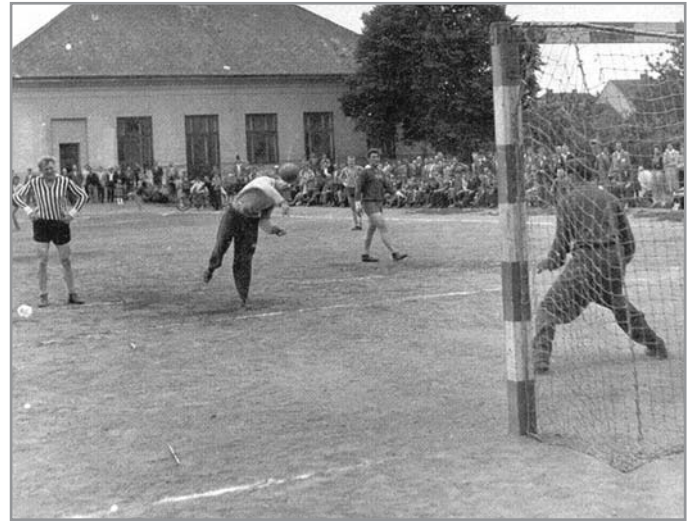
Ivančice - sokolovna, rok 1958

Po ukončení války v květnu 1945 se začíná hrát na sokolovně za obtížné situace Sokola. Byl nedostatek cvičitelů, funkcionářů