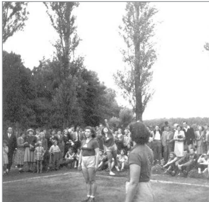
Utkání žen Jiskry Trhárny Ivančice kolem roku 1955

V krátké době se volejbal rozšířil i v okolních městech a vesnicích, takže bylo možné pořádat turnaje nejen v Ivančicích, ale i v M. Krumlově, Dolních Kounicích, Střelcích, Ketskovicích... Jen do Brna se jezdilo vlakem, jinak zásadně na kole. Pokud se turnajů neúčastnila mužstva z Brna, pak volejbalisté z Ivančic turnaje vyhrávali. Při účasti brněnských družstev bylo družstvo Sokola Ivančice na 2. - 4. místě. Hráči měli vlastní tilka, trenérky a sportovní obuv. Když bylo