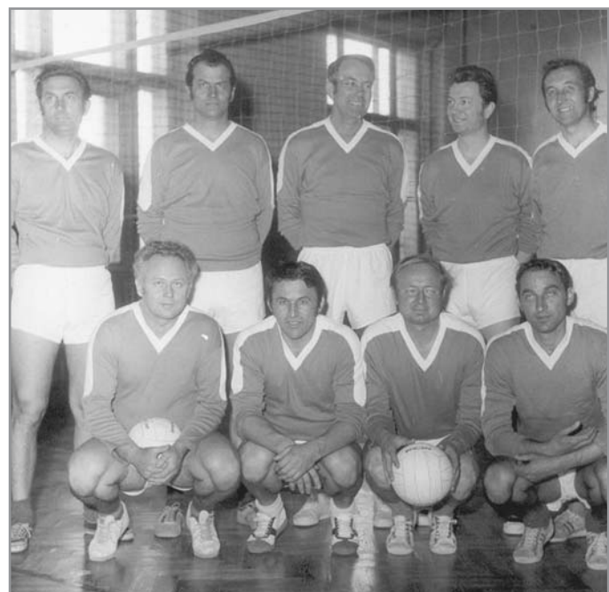
Družstvo Ivančic na turnaji veteránů v roce 1977