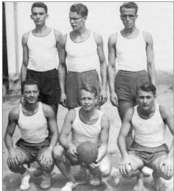
Volejbalové družstvo ivančického Sokola v roce 1938

Pohromou pro ivančické hráče bylo, když měli dělat protihráče dorostenkám nebo ženám Sokola. To bývalo na příkaz náčelníka Sokola, aby se i ženy něčemu přiučily. Pokud se některý z hráčů zapomněl a zasměčoval, okamžitě slyšel z ženské strany nadávky, že je surovce, který chce ženy zničit a podobně. Takže se jen pinkalo, což byla pro muže hrozná nuda. Sokol měl hřiště pro odbíjenou na sokolovně, orlové si vybudovali hřiště na dvoře orlovnou v Chřes-