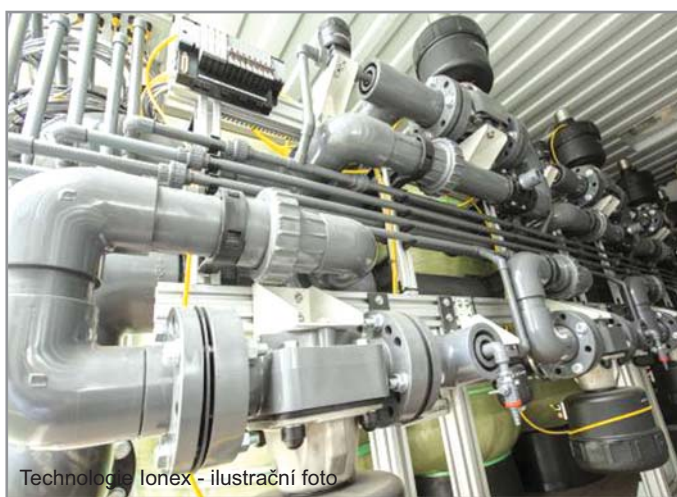
Technologie Ionex - ilustrační foto

/Moravský Krumlov/ Kvalitnější pitná voda poteče do konce letošního roku z kohoutku obyvatel Moravského Krumlova. A to díky rozsáhlé investici, kterou právě do úpravy pitné vody ve městě schválili v těchto dnech představitelé svazku Vodovody a kanalizace Třebíč.