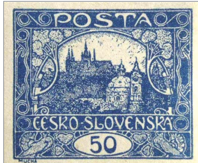
Autorem první známky československého státu byl Alfons Mucha

Až po téměř 15 letech, k datu 15. srpna 1934, vyšly další legionářské známky k 20. výročí založení čs. legií. Platnost známek byla ukončena 15. března 1937. Politická situace v Evropě se začínala zhoršovat a bylo jasné, že republika se válečnému střetu nevyhne. Od té doby se již každý dorodně, a to i v roce 1939, setkává