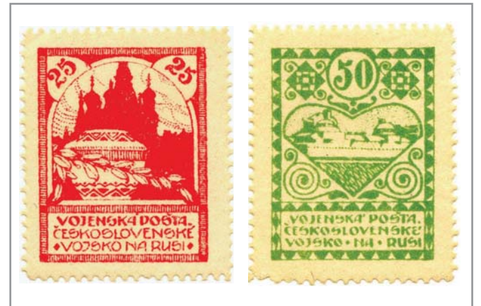
Známky z prosince 1919, kdy byla vydána série tří vojenských známek. S motivem čs. legionáře a vyobrazených dvou známek s motivy ruského chrámu a legionářského obrněného vlaku.

Rok 1935 byl dalším rokem kulatého výročí, a to výročí bitvy u