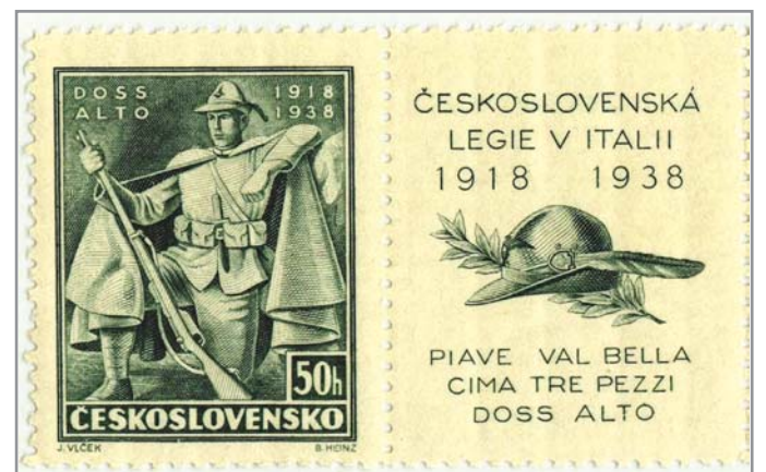
Známka připomínající vznik čs. legií v Itálii v dubnu 1918