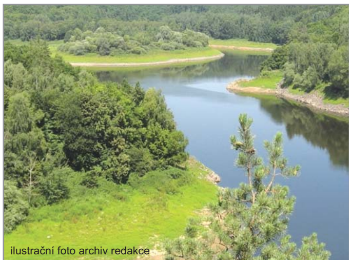
ilustrační foto archiv redakce