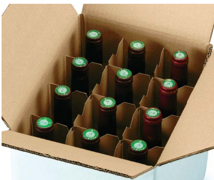
ilustrační foto web

Vládní novelu vinařského zákona podporuje kraj i Svaz vinařů. Jihomoravský kraj, kde se nachází přes 90 procent vinic v republice, považuje společně s vedením Svazu vinařů novelu vinařského zákona za krok dobrým směrem. Jak zdůraznil hejtman Michal Hašek, chrání jak naše spotřebitele, tak i poctivé moravské a české vinaře a obchodníky s vínem. Řeší nově