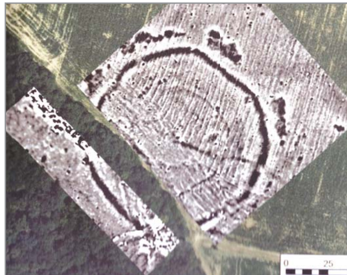
Detail kruhového objektu u Nových Bránic

Četnost objektů podobného charakteru logicky navozuje porovnání s jinými situacemi. Obecně se nejedná o nijak výjimečný typ v rámci středoevropského prostoru. V komparaci s jinými obdobnými strukturami se jedná o středně velký typ rondelu. Podobá se rondelu v nedalekých Vedrovicích nebo v Němčičkách, na Slovensku v Prašníkách a z Rakouska z Friebritz 2, Glaubendorf 1, Karnabrun-