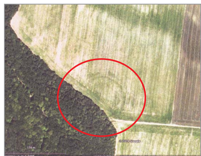
Kruhový objekt dnes z části zasahuje do prostoru lesa Google Earth

Povrchovými průzkumy zde bylo na základě keramiky doloženo osídlení ze staršího neolitu kultury s lineární keramikou, z mladšího neolitu, konkrétně z nejstarší fáze la období kultury s moravskou malovanou kerami-