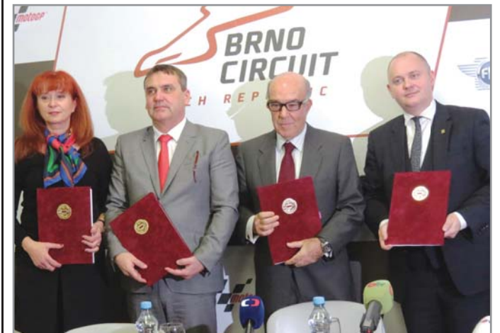
Po podpisu promotérské smlouvy