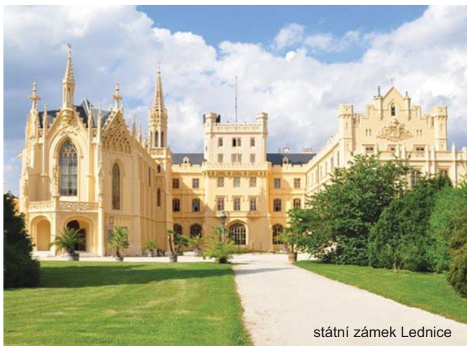
státní zámek Lednice

Jižní Morava je nesporně turisticky atraktivní region naší země i evropského kontinentu. V těsném sousedství jsou zde hned čtyři památky UNESCO (kulturní krajina Lednicko-valtického areálu a funkcionalistická vila Tugendhat v Brně, slovácký verbuňk a Jízda králů jako dva klenoty nehmotného kulturního dědictví) a také dvě biosférické rezervace UNESCO (Bílé Karpaty a Dolní Morava), jejichž význam je srovnatelný.