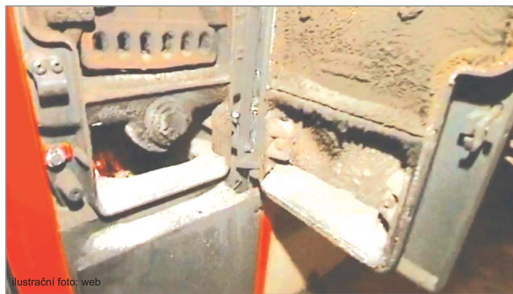
ilustrační foto: web

Pro rok 2015 to je i Jihomoravský kraj, který stanovil pro poskytnutí dotace následující podmínky. Výše dotace se bude pohybovat od 70-80 %. Přihlíženo bude zejména k typu pořizovaného zdroje a lokalitě, kde bude výměna kotle provedena. Pokud to bude v obci, která byla Střednědobou strategií zlepšení kvality ovzduší v ČR označena jako prioritní území, bude výše podpory navýšena o dalších 5 %. Maximální limit za výměnu kotle