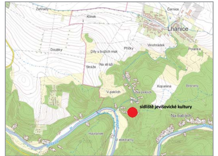
Obr. 1: Poloha výšinného sídliště jevišovické kultury u Lhánic (mapa převzata ze serveru www.crr.cz , upraveno).

do vhloubené výzdoby lze zařadit pro tuto kulturu typické slámování, ale i rýhy, jamky a další prvky (obr. 2). Z keramického těsta jsou vyhotoveny také přesleny, také na