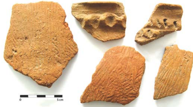
Obr. 2: Zlomky zdobených keramických nádob

Povědomí o pravěkém výšinném sídlišti u obce má dlouhou tradici. Podle některých zdrojů o ní věděl dokonce již v 80. letech 19. století Karel Jaroslav Maška (profesor matematiky a především archeolog, který se proslavil objevem neandertálských pozůstatků v jeskyni Šipka u Štramberka, ale i bádáním v Moravském krasu). Lhánickou lokalitu znovuobjevil v roce 1925 učitel a přírodovědec Rudolf Dvořák, který prožil