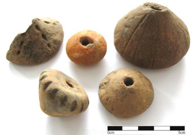
Obr. 3: Různě tvarované a zdobené keramické přesleny

Pokud se na místo v současnosti vypravíme, mnoho stop ze života našich předků zde nespátíme, snad jen pozorný návštěvník si pozorně pozůstatků opevnění. Přesto stojí za to se na toto místo ležící v malebné krajině nad hlubokým údolím vypravit. Jitka Kučová