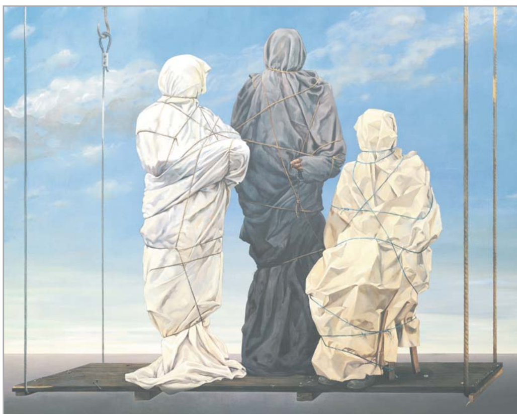
Theodor Pištěk, 'Rodinný portrét', 1976, olej na plátně, 220 x 300 cm

Museum Kampa – Nadace Jana a Medy Mládkových a Město Moravský Krumlov si Vás dovoluují pozvat na otevření stálé expozice