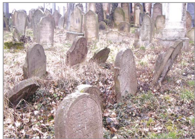
Část hrobů uprchlíků na starém hřbitově v Ivančicích

Přítomnost Židů z Haliče v Ivančicích ukázala, jak daleko už pokročila celková emancipace ivančických Židů a jak se lišili od svých ortodoxních souvěrců z Haliče. Ti pobíhali po Ivančicích a okolních vesnicích v dlouhých černých kaftanech a s dlouhými pejzy, mluvili nerozumitelnou němčinou - jidiš, vykupovali nezákonně potraviny, vajíčka, drůbež, maslo a sádlo a za drahé peníze na černo prodávali v Brně a ve Vídni, čímž proti sobě popuzovali českou chudinu v Ivančicích, která trpěla špatným zásobováním. Tento řetězový obchod čili keřasení provozovali i někteří místní židovští obchodníci, ale u haličských Židů to bylo tak okaté, že se jimi ivančičtí Židé cítili kompromitováni.