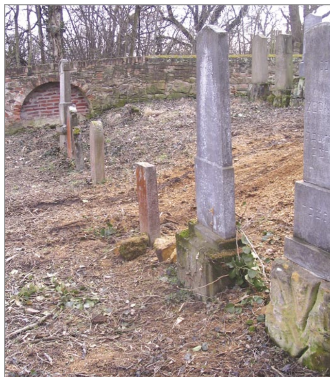
Několik hrobů zemřelých vystěhovalců z Haliče

Další skupinou osob, která se během války v Ivančicích pohybovala, byli ruští zajatci. Už nevíme, kolik jich v Ivančicích a okolí bylo. Pracovali na místech, odkud odešli muži do války. Známý je případ jejich využití při stavbě budovy nové přádelny textilky v Alexovicích v roce 1916. Byli ubytováni v domě, kterému se dodnes říká „Na Palandě“, další pracovali v lihovaru v Němčicích, nebo při zemědělských pracích apod. Jsou známa tři úmrtí zajatců, všichni byli pohřbeni v řadě se zemřelými Židy u vojenského lazaretu.