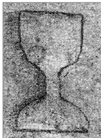
Obr. 2: M. Krumlov - náhrobní kámen údajně Bohuslava ze Švamberka s kalichem v dlažbě kostela Všech svatých (dle Fišer, red. 2009).

„Bohuslav ze Švamberka, seděním na Boru a Krasíkově, byl od samého počátku bouří věrný katolík, kterýž, spojiv všechnu válečnou moc v kraji Plzeňském, odpíral r. 1419 a 1420 jako vůdce královský velmi zuřivě husitům a jmenovitě Žižkovi; ale byl r. 1421 při dobývání hradu Krasíkova od