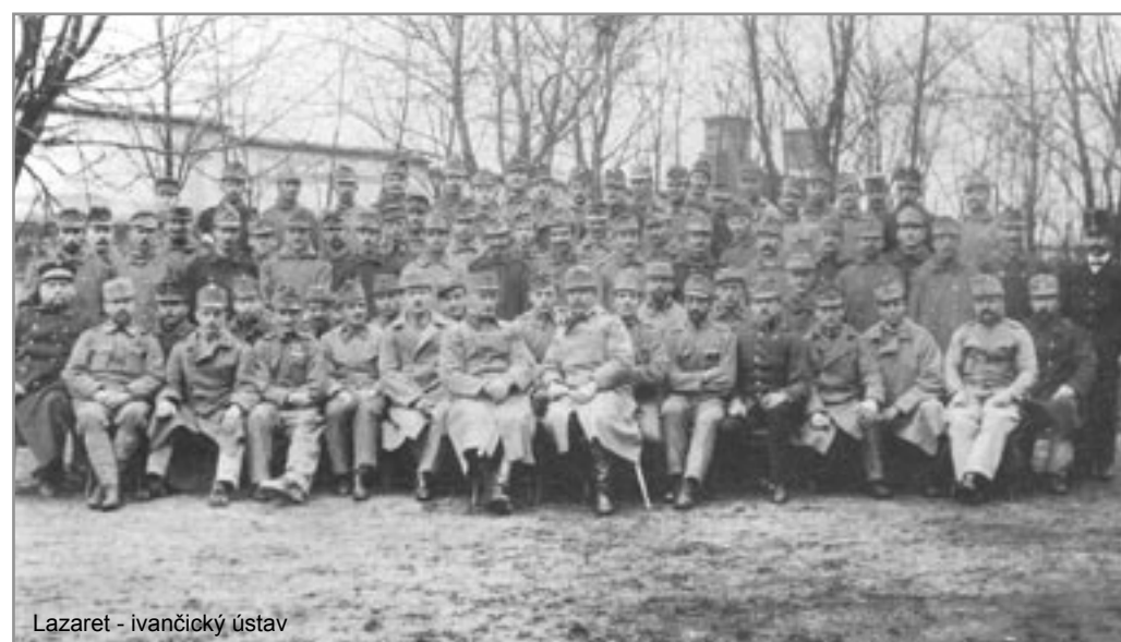
Lazaret - ivančický ústav

Musíme připomenout, že mobilizace se týkala také koní. Na základě dřívějších seznamů bylo město zbaveno nejlepších tažných koní. Do Brna bylo také dodáno dvacet dvojsprężných vozů. Odvod