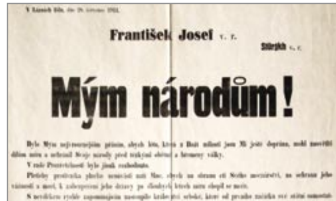
Část z císařského manifestu, který napsal František Josef

Dne 28. července 1914 vydal císař František Josef I. manifest „Mým národům“, který v podstatě znamenal vyhlášení války. Dne 31. července byly v Ivančicích vyvěřeny plakáty o všeobecné mobilizaci