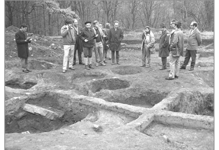
Archeologická komise na hradisku při výzkumu v 70. letech

Ve starší době železné (asi 750 - 450/370 př. n. l.), která je podle slavné rakouské lokality označována rovněž jako doba halštatská,