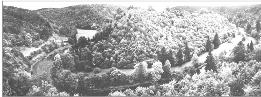
Pohled na kramolínské hradisko