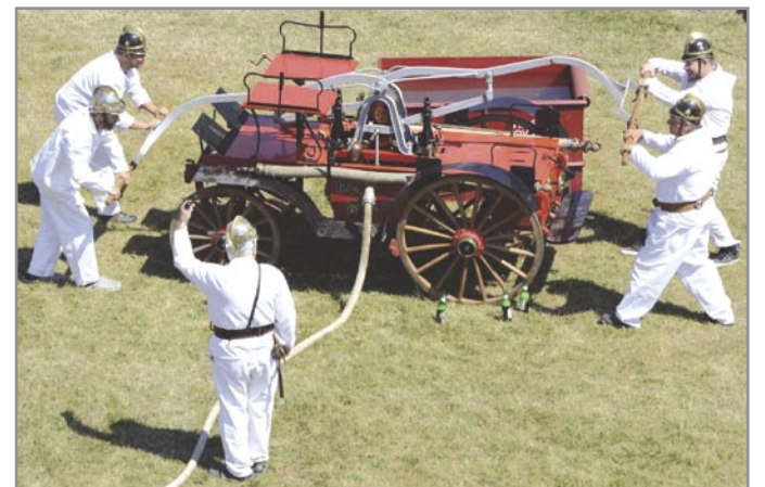
O předvádění historické ruční stříkačky byl při oslavách velký zájem.

Použití prameny: Protokoly o zasedání obecního výboru - zastupitelstva, SOKA Rajhrad, fond C 79, kat. číslo 2 • Protokoly o zasedání obecního zastupitelstva, SOKA Rajhrad, fond C 79, kat. číslo 3 • Informace od Obecního úřadu Nová Ves.