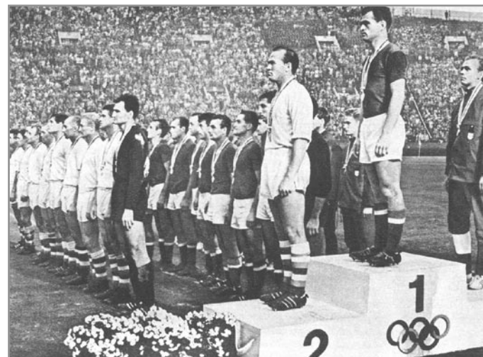
Olympiáda Tokio 1964 - reprezentace ČSSR vybojovala stříbro

na luxusní hotel s původními klenutými stropy. V objektu obenaném zdí je naprosto soukromí a veškerý komfort počínaje lázněmi a vyškolenými masérkami, fitness a luxusní restaurací s asijskými specialitami. Trenér musí mít dobré ubytovací podmínky, aby mohl pro mužstvo stanovit průběh dalších dnů. Byl proto ubytován v prezidentském apartmánu o velikosti 150 m 2 , za který se platí 165.000 Kč/noc. Hráči jsou zřejmě skromnější a takovou úroveň nepotřebují. Proto byla jejich cena za ubytování pouze ve výši 7.000 Kč/noc. I tak si myslím, že by se do hotelu, který by neměl pět hvězdiček, vůbec nenastěhovali. Kde a jak byli ubytováni čs. reprezentanti, nevím, ale byli zcela určitě také v několika hvězdičkovém hotelu. Myslím, že nemá význam porovnávat podmínky fotbalistů před 60 lety s dnešními, ale lze porovnávat výsledky.