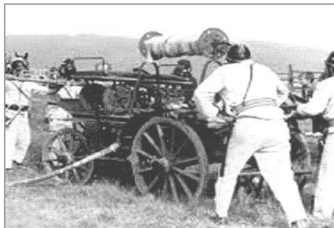
Výcvik novoveských hasičů mezi válkami

tato situace řešena pro Moravské markrabství vydáním zákona č. 35/1873, který mimo jiné uprvoval preventivní protipožární opatření a vlastní postup při hašení požárů. V § 34 přímo nařizoval představeným obcí s více jak sto domovními čísly, aby usilovali o zřízení dobrovolných hasičských sborů. Vyzvání k založení těchto spolků měl představený obce vyžadovat každoročně. Ne všude bylo možné hasičský sbor v krátké době zřídit, ale sbory postupně vznikaly.