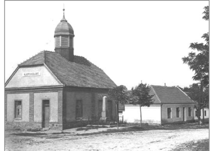
Nová Ves - hasičská zbrojnice v roce 1942

Dne 14. února 1914 byl v obci založen Sbor dobrovolných hasičů za účasti 21 zakládajících členů. Starostou sboru byl zvolen František Klika. Na přijímací listině ze dne 8. března 1914 je uvedeno 30 členů. O měsíc později, v březnu 1914, žádá hasičský sbor, aby 1 pár koní v obci byl pojištěn a aby poplatek pro přepravu stříkačky pro první tři roky zapravila obec z obecní pokladny. Usnesením obecního výboru byl tento požadavek splněn a poplatek za pojištění 1 páru koní byl zaplacen z obecní pokladny. Slavnostní vysvěcení hasičky se