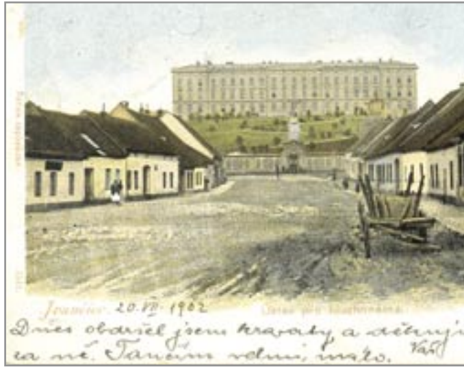
Pohlednice datovaná do roku 1902

Dne 10. září 1888 byla Zemskému sněmu v Brně předložena zpráva, že na Moravě je 486 neslyšících dětí, kterým se nedostává žádného vzdělání. Na základě této informace rozhodl dne 4. listopadu 1889 Zemský sněm o zřízení dvou internátních škol pro neslyšící děti na Moravě a dne 6. dubna 1892 rozhodl o stavbě ústavů v Ivančicích a Lipniku nad Bečvou. Současně schválil rozpočty staveb (133.500 zl. a 117.500 zl.). Pro vnitřní vybavení ústavů byla pro každý ústav určena částka 8.500 zl. na vnitřní zařízení.