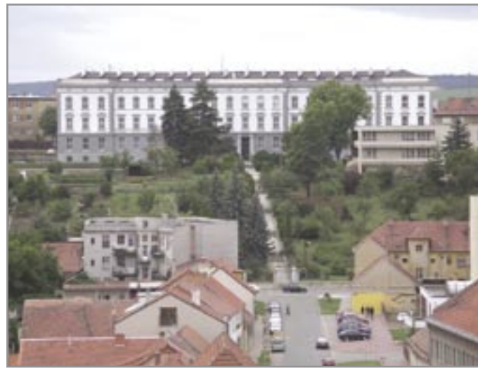
Novodobý pohled z ivančické věže

Použité prameny: Pamětní kniha města Ivančice - SOkA Rajhrad; Ivančický zpravodaj 3 - 7/1974