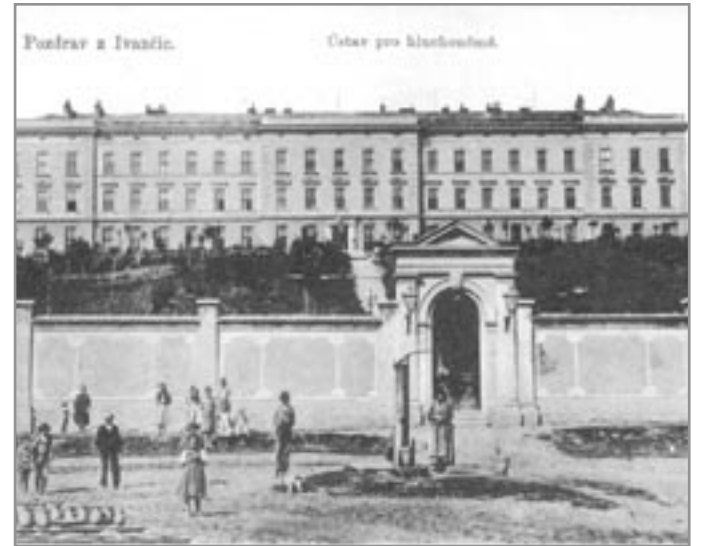
Ústav pro hluchoněmé, kolem roku 1915

Druhá světová válka opět hrubě zasáhla do práce ústavu. Koncem roku 1938 zde bylo po tři měsíce ubytováno vojsko čs. armády, v červnu 1941 zde po tři týdny odpočivaly