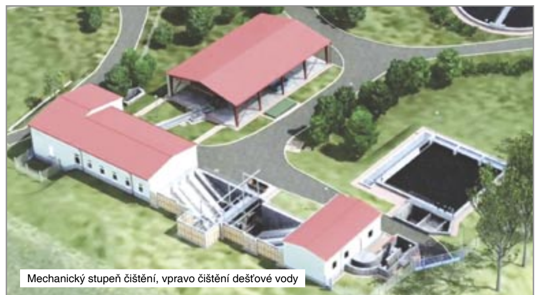
Mechanický stupeň čištění, vpravo čištění dešťové vody