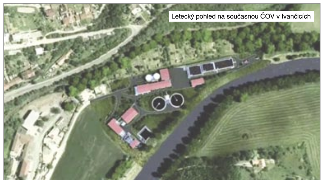
Letecký pohled na současnou ČOV v Ivančicích

Projekt se několikrát měnil a také náklady ze zvyšovaly nad konečných 120 milionů, přičemž do projektu byly zahrnuty přečerpávající stanice a kanalizační sbě-