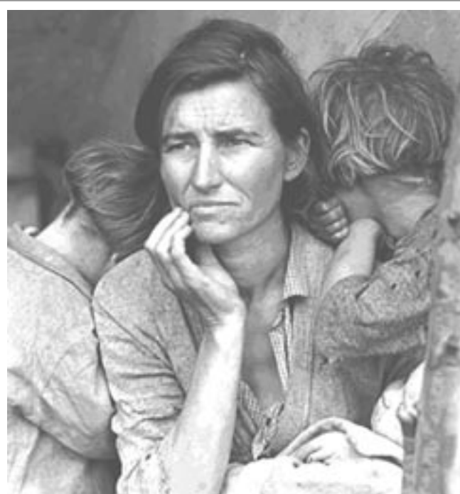
Matka přistěhovalkyně v roce 1936