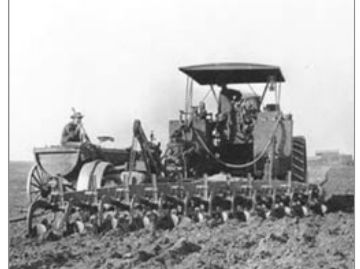
Parní traktor s dvanácti radlicemi