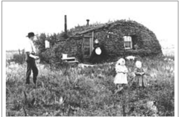
Fred Hulstrand - Drnový dům v roce 1898

Fred Hulstrand byl profesionální americký fotograf. Narodil na farmě švédským přistěhovalcům jako třetí ze šesti dětí. V roce 1905 Hulstrand byl u toho, když jeho soused vyvolával negativy v suterénu svého domu a byl fascinován. V roce 1909 si zaplatil za soukromé hodiny u fotografa v Miltonu a začal se živit fotografováním. Díky němu jsou k dispozici desítky fotografií z doby ze začátku 20. století, které zobrazují způsob života přistěhovalců na tehdejších farmách, přičemž dbal, aby na většině fotografií byli lidé při nějaké činnosti. Musíme upozornit, že není soulad mezi uváděným rokem zhotovení fotografie drnového domu a v té době stářím Hulstranda. V roce 1898, který je uváděn jako rok