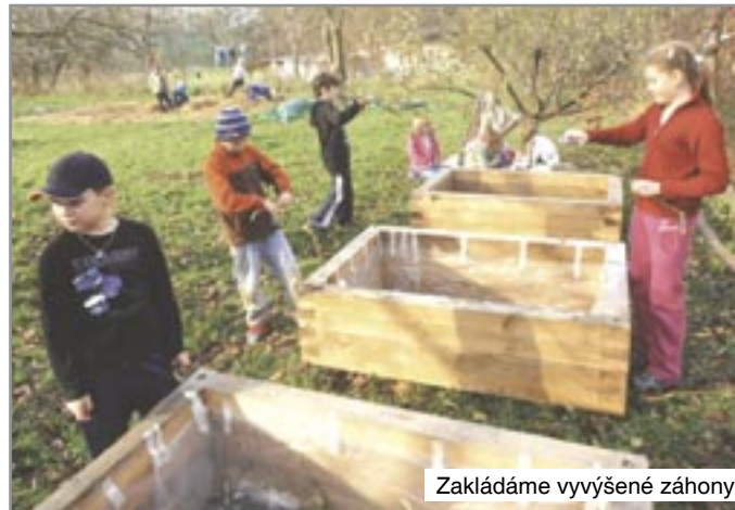
Zakládáme vyvýšené záhony

Naše školní zahrada je místem setkávání. Pravidelně se tu potkávají děti z mateřské školy s dětmi z družiny. Hrají si zde společně kluci i holky, školáčky, ale i prvňáci s páťáky. Rádi tu setrvávají maminky nebo tatínky, když si přijdou odpoleďne pro své ratolesti. Odehrávají se tu významné akce v životě školy, nejen zahájení a rozloučení se školním rokem. Těchto akcí se vedle dětí, rodičů a prarodičů účastní i bývalí žáci a další hosté.