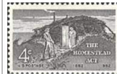
Poštovní známka vydaná Ministerstvem financí USA v roce 1962