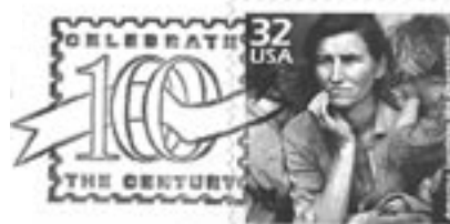
Matka přistěhovalkyně na známce z roku 1998