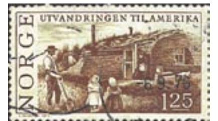
Poštovní známka vydaná v Norsku v roce 1975