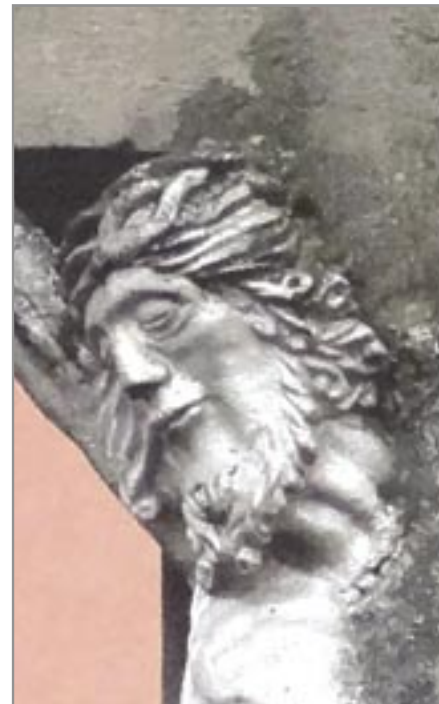
detail tváře Mohelno 1844