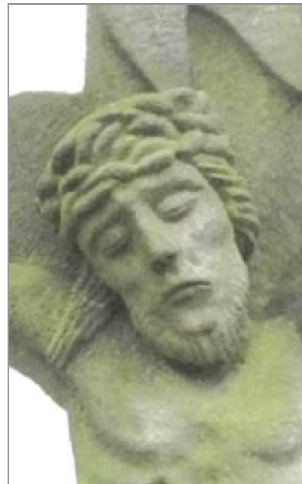
detail tváře Valeč 1817