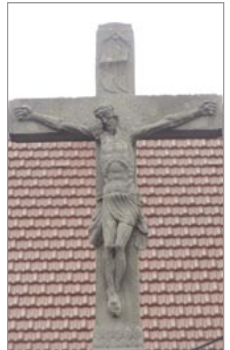
detail kříže Želešice II

jsou malá ústa a vousy jen po obvodu obličje. Zejména u pozdějších křížů také vyhublé postavy s vystouplými kostmi. Při posuzování Jakubova autorství také pomohly některé opakující se výzdné detaily.