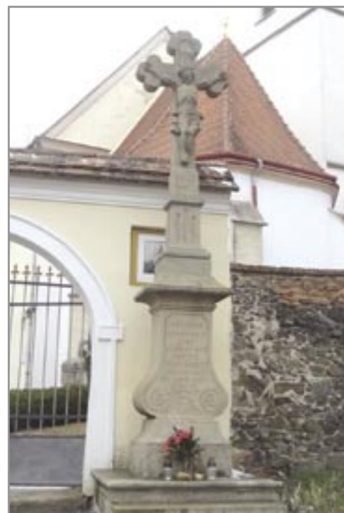
Želešice I. 1827