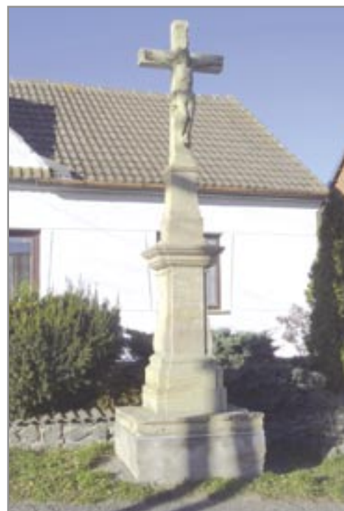
Miroslavské Knínice 1820