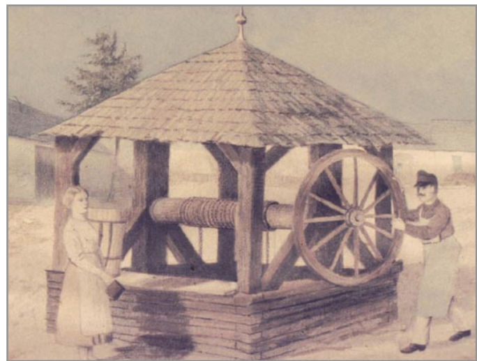
Studna na Hlíkách v roce 1885 - obrázek Jakuba Svobody

Dne 27. září 1836 byla potvrzena smlouva mezi magistrátem města Ivančic a židovskou obcí o připojení vodovodu do židovských lázní. Město totiž dříve dovolilo, aby si židovská obec z městského vodovodu vedla vodu svými rourami do starých lázní. Když si ale r. 1836 židovská obec postavila nové lázně, byla s městem Ivančice sepsána nová smlouva, po které směla židovská obec položit potrubí do nových lázní na vlastní náklad za roční poplatek 4 zlaté vodní činže