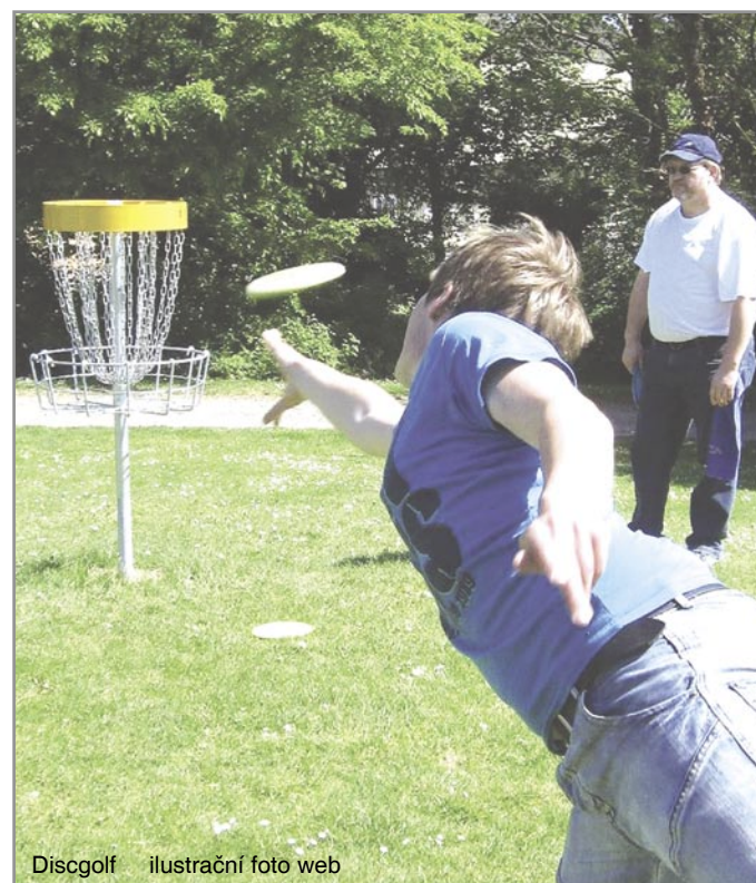
Discgolf ilustrační foto web

Záměr se jeví jako zajímavá alternativa, jak získat zpět především aktivní turisty, a částečně by tak mohl „zalepit“ úbytek na poli turistického ruchu po ztrátě Slovanské epopeje. /PeSl/