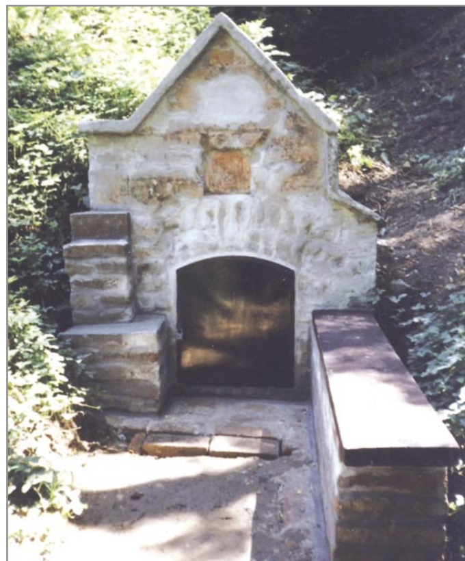
V Joštu 28. července 2001

25. října 1884 - schvaluje se studna pro dolní Kounickou ulici (U moravské orlice).