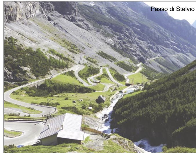
Passo di Stelvio

Začínáme pomalu stoupat k prvnímu průsmyku Jaufen-pass ve výšce 2099 metrů. Každý volíme svoje tempo jízdy a setkáváme se na vrcholu. Pořizujeme pár snímků a jedeme dál. Cesta nás vede směrem na Merano, kde