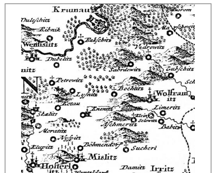
Müllerova mapa z roku 1716

Nemáme mapu Stabliniho katastru pro Miroslav, pro čtenáře k vysvětlení alespoň několik údajů týkajících se Ivančic. V Ivančicích byly všechny pozemky vyměřeny v roce 1825 a založena mapa tzv. Stabliniho katastru. Má 11 listů, ulice nejsou popsány, ale traťová jména v okolí města uvedena na mapě platí dodnes, stejně jako číselvární jednotlivých pozemků. Později