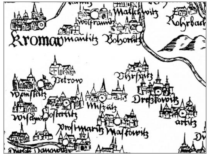
Fabriciova mapa z roku 1569

Mikulov - Pohořelice - Brno, nebo Brno - Jihlava, silnice Znojmo - Ivančice byla postavena později. Názvy obcí pouze v němčině.