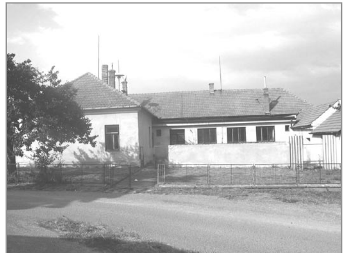
Výuka ve škole v Budkovicích skončila 30. června 1976

Vysoký počet žáků, který stále pohyboval kolem 90, byl trvale pro jednoho učitele a v jedné místnosti neúnosný, ale až 25. listopadu 1895 schválila zemská rada rozšíření na dvojtrždku s jedním učitelem a pomocníkem. V roce 1896 byl předložen návrh posouzen okresní komisí a v květnu 1897 se začalo se stav-