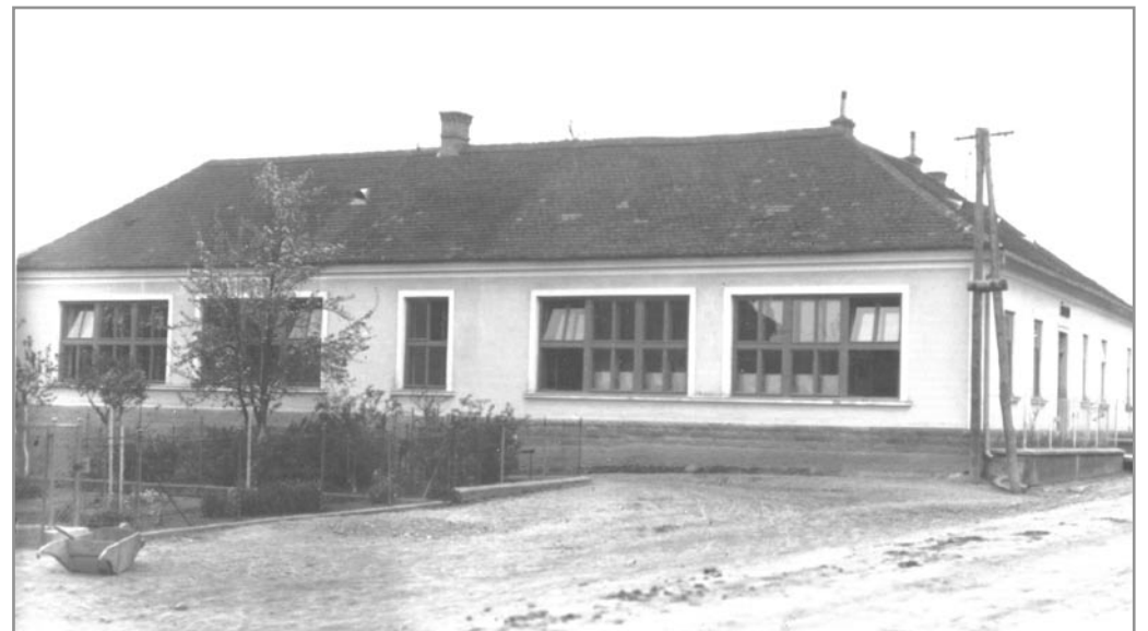
Budova školy v Budkovicích v roce 1925 při pohledu od Křížku

Použití prameny: Pamětní kniha školy v Budkovicích - SOKA Rajhrad • Pařilová D.: Budkovice