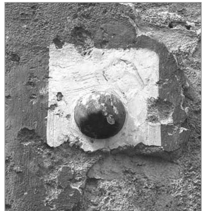
Dělová koule ve zdi miroslavského zámku

Použité prameny: Plaček M.: Ilustrovaná encyklopedie moravských hradů, hrádků a tvrzí • Hodeček D.: Nástin dějin zámku v Miroslavi - Sb. SOkA Znojmo 2008