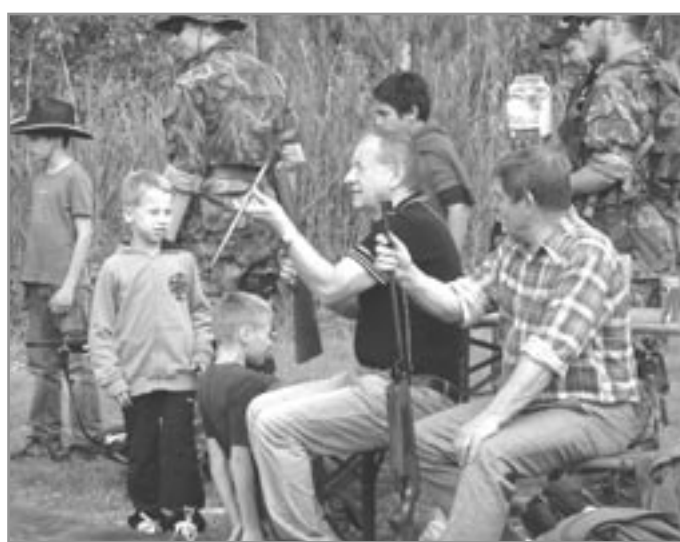
Z dětského dne v Rakšicích

I přes příjemné počasí ale pořadatelé zaznamenali pokles návštěvnosti. Snad i proto, že ve stejný termín se konal velký rockový festival v Miroslavi. /abč/