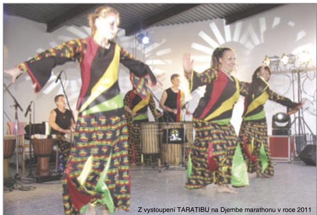
Z vystoupení TARATIBU na Djembe marathonu v roce 2011

„Festival je plný energie, pohybu, barev, hudby a her. Přesně tak si představují moderní rodinný