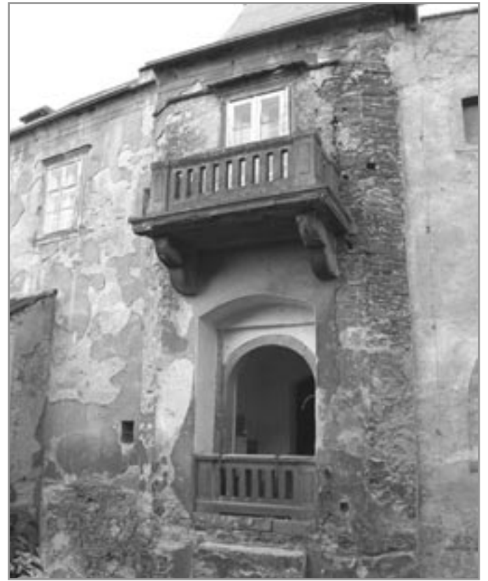
Původní brána miroslavského zámku

Po převzetí zámku premostratský byl zřízen nový most přes příkop a nad vjezd byla vsazena deska, snad přenesená z Louky, s letopočtem 1665. Noví majitelé se ihned pustili do rozsáhlých stavebních úprav. Když po sto letech