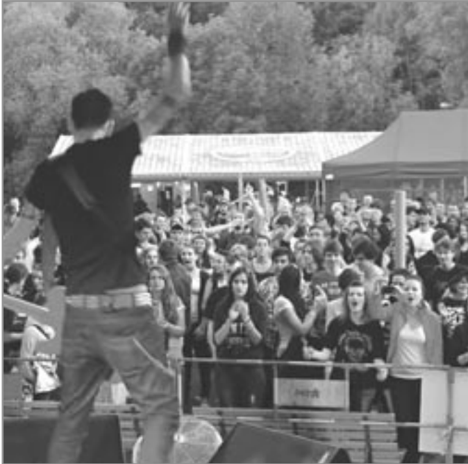
Skvělá atmosféra na rockovém festivalu VRABČÁK

V pořadí druhý se konal 18. května další ročník rockového festivalu VRABČÁK . Již vyhlášená akce přilákala i díky skvělému počasí na břehy rybníka fanoušky tvrdší muziky, které nezklamaly oblíbené kapely. Pro tento rok perfektně zvládnuté zázemí, dobrá nálada a úroveň účinkujících dokázaly fanoušky dostat do varu, obzvláště při kulminaci programu.