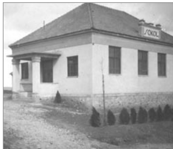
Budova Sokola ve Višňově

Poznatky čerpány z Archivu ve Znojmě, a z brožury „750 let Višňové“, bývalých členů a mé vzpomínky. /JKV/