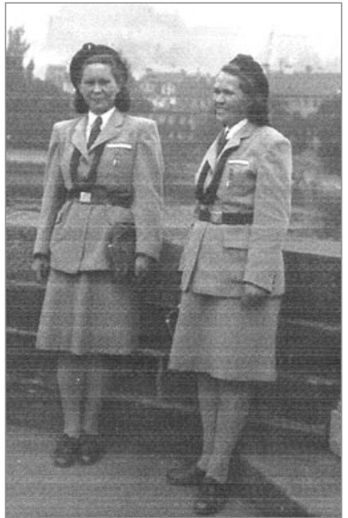
Členky Sokola ve Višňově ve stejnokrojích