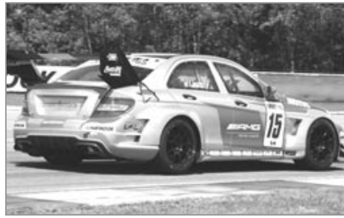
Bývalý pilot F1 V. Liuzzi na brněnském okruhu

Masarykův okruh hostil poprvé šampionát Superstar Series. Mimo závody super silných cestovních vozů, kde obsah motoru nemůže být nižší než 3,8 litru s minimálně šesti válci, se jely během víkendu i další závody: GTSprint International Series, Ferrari Challenge a VW Castrol Cup.