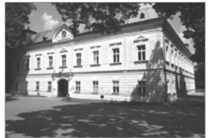
Zámek v Tavíkovících

Hlavní výhodou těchto nových podniků byla v tom, že nebyly členy cukrovarského kartelu, a nebyly tedy nuceny část cukru při ztrátových cenách vyvážet do ciziny. Byla to obrovská výhoda, protože na domácím trhu se cukr