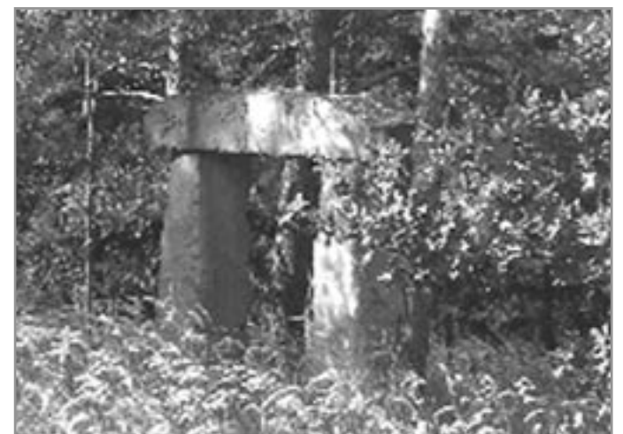
Dolmen v blízkosti soutoku Rouchovanky a Rokytné