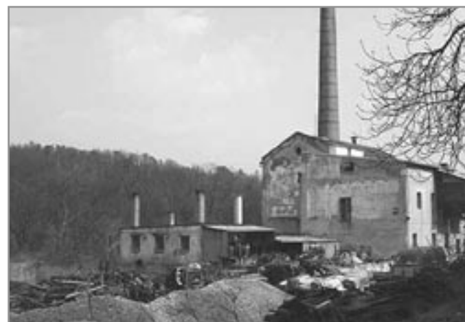
Takhle asi lihovar dříve nevypadal - současné foto

Použití prameny: Selské listy, ročník 45, čís. 27 - 2. dubna 1927, pokračování č. 29, 9. dubna 1927, vždy str. 1. Vachutka, R.: Rozčarování z malých hospodářských cukrovarů. In: Věstník Ústřední jednoty řepařů československých, roč. XIV, únor 1933, č. 2, s. 17-19; informace z internetu.