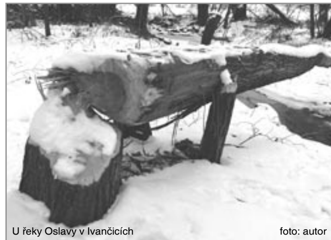
U řeky Oslavy v Ivančicích

Sovětského svazu. Po druhé světové válce začali postupně vysazovat bobry zpět na ztracená území v Polsku, Německu, Rakousku, Holandsku, Francii, Švýcarsku a v mnoha dalších zemích. Česká republika se k těmto aktivitám připojila v letech 1991 a 1992 vysazením dvaceti bobrů na řece Moravě u Olomouce. To už na jižní Moravě žili téměř deset let bobři, kteří se sem šířili