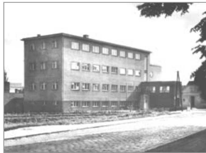
Budova bývalé Živnostenské školy

Často se turisté, kteří navštíví Ivančice, ptají na historii budovy na Krumlovské ulici, která je v podvědomí Vančáků nazývána Živnostenskou školou. Přesto, že budova pamatuje cca 70 let, stále má moderní vzhled.