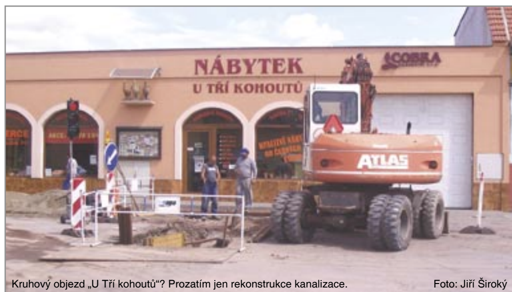
Kruhový objezd „U Tří kohoutů“? Prozatím jen rekonstrukce kanalizace.

Peticí podepsalo 339 občanů. K této petici se vyjádřil vedoucí Odboru regionálního rozvoje